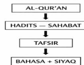
Gambar siklus Kembali ke Al-Qur'an (Validasi Makna)

Dengan pendekatan siklus ini, penafsiran tidak berhenti pada satu tahap, tetapi terus mengalami proses evaluasi dan penguatan. Hal ini sejalan dengan prinsip bahwa tafsir harus selalu berada dalam koridor wahyu dan tidak terlepas dari sumber-sumber otoritatif (Ibn Taymiyyah, 1999; Az-Zarqani, 2001).